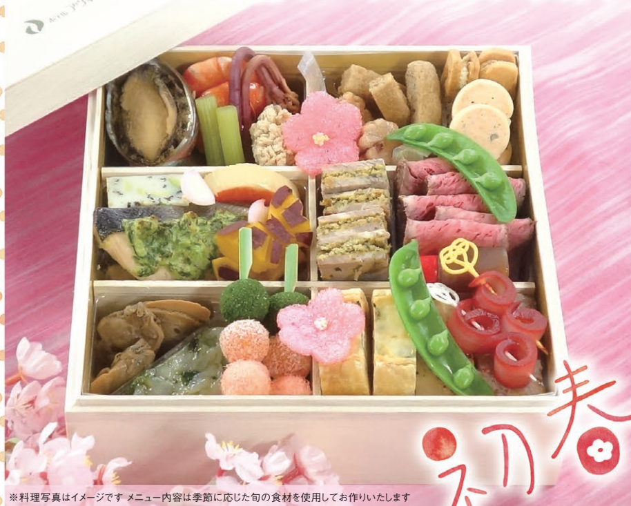
※料理写真はイメージです。メニュー内容は季節に応じた旬の食材を使用してお作りいたします